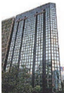
最佳盛品 酒店尖沙咀