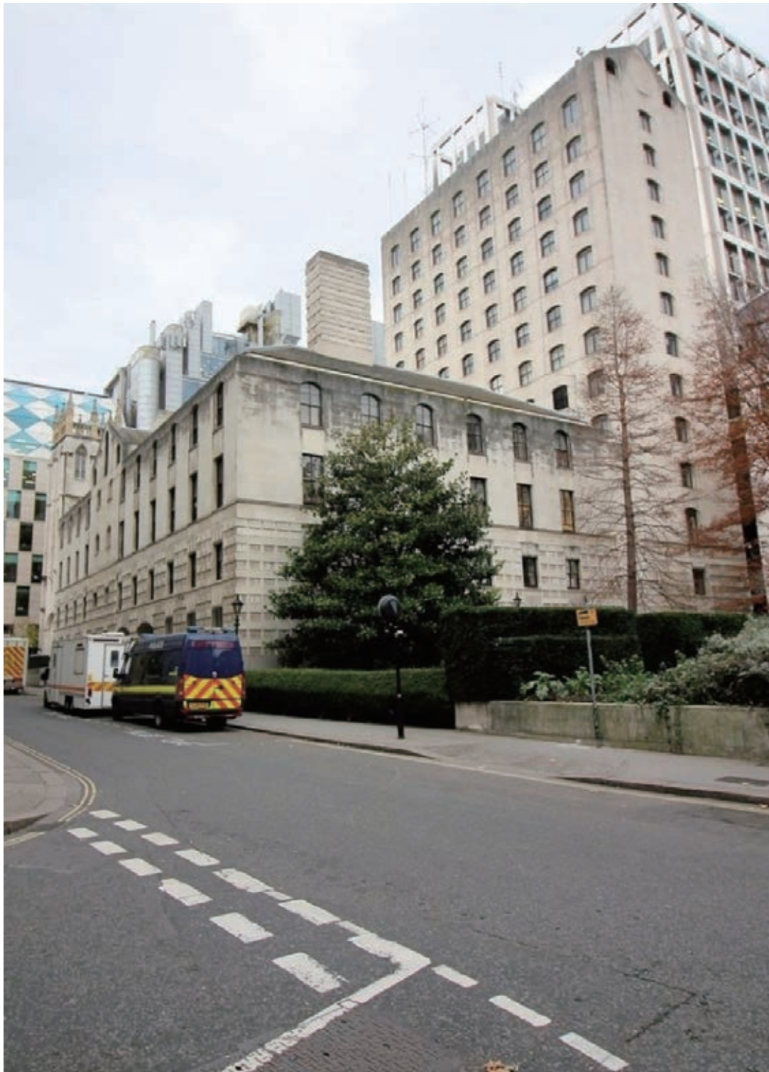
英國倫敦EC2區木街(Wood Street) 37號