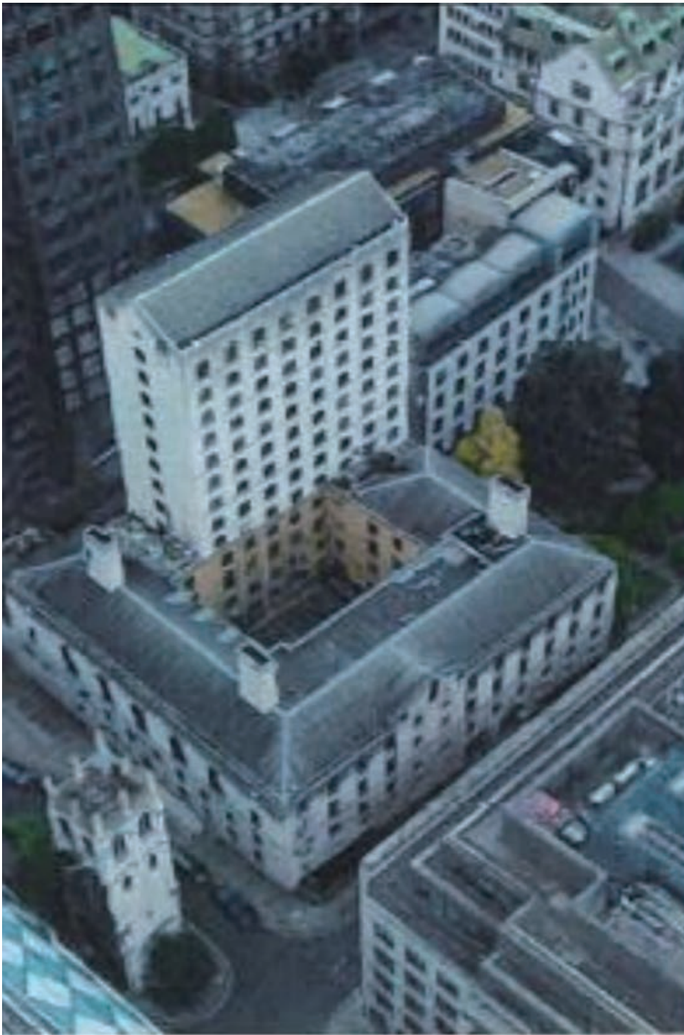
英國倫敦EC2區木街(Wood Street) 37號